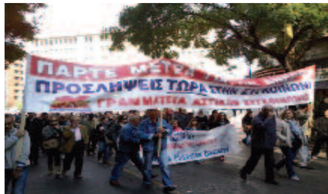
Μαζικό ήταν το μπλοκ του ΠΑΜΕ ΑΣΤΙΚΩΝ ΣΥΓΚΟΙΝΩΝΙΩΝ.