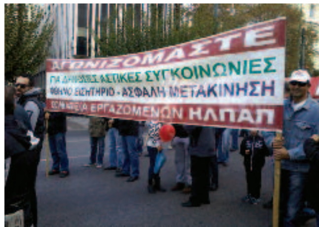
Οι συνάδελφοι των τρόλεϋ με το πανό τους.