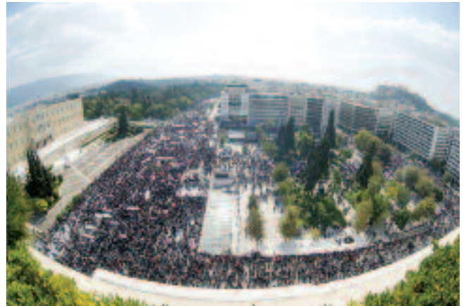
Αποψη από ψηλά της Πλατείας Συντάγματος

Με αφετηρία τη χτεςινή κινητοποίηση, δίνουμε όλοι τη μάχη για την επιτυχία της πανεργατικής απεργίας στις 27 Νοέμβρη.