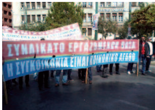
Το πανό του Συνδικάτου Εργαζομένων ΟΑΣΑ.