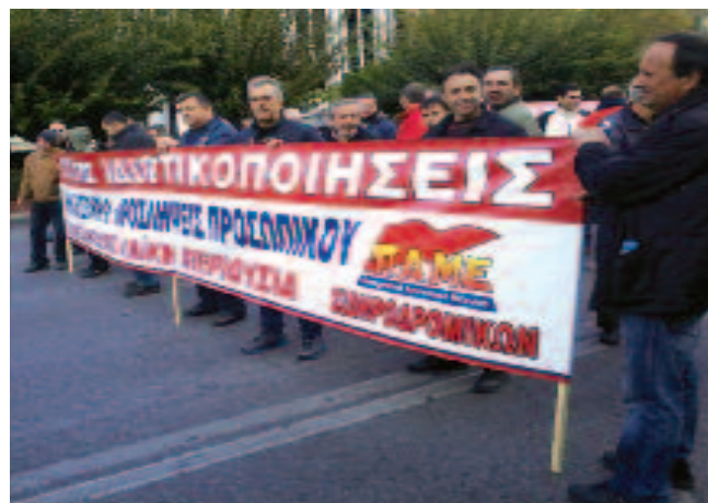
Το μπλοκ των σιδηροδρομικών.