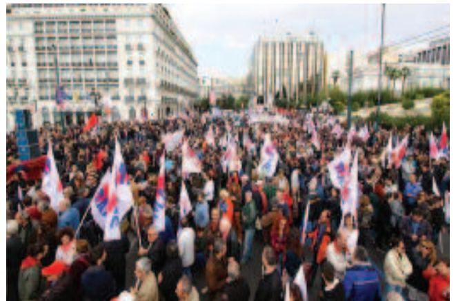
Κατάμεστη από διαδηλωτές η λεωφόρος Αμαλίας.