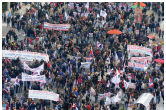
Να ξαναβουλιάξει η Αθήνα με την απεργία στις 27 ΝΟΕΜΒΡΗ.