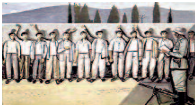
«Η εκτέλεση των 200 στην Καισαριανή» έργο του χαρακτή Τάσσου.

Στη γλώσσα των κατακτητών (και των συνεργατών τους) «ανανδρία» ήταν ο ηρωικός αγώνας ενάντια στην Κατοχή.