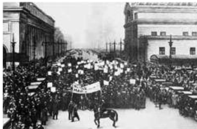
Σύγκρουση απεργών και αστυνομίας στο Σικάγο.

Εκεί κοντά βρισκόταν το αστυνομικό τμήμα της οδού Ντεπλέν, με διευθυντή τον αστυνόμο Τζον